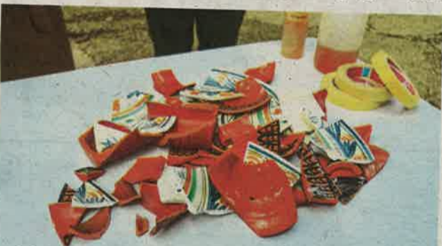
Arheološku radionicu rekonstrukcije keramike vodila je restauratorica iz Međunarodnog centra za podvodnu arheologiju

Kada smo prije pet godina provodili prvu akciju u Salima i mi i mještani smo se neugodno iznenadili količinom otpada koji smo izronili, no sada mogu s ponosom kazati kako je situacija puno bolja, te kako je saljski akvatorij mnogo