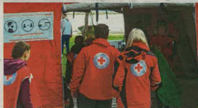
Gradsko društvo Crvenog križa organiziralo je pokaznu radionicu prve pomoći, ekološku radionicu i stanicu za mjerenje šećera i tlaka

i opremu. Već desetljećima primjećujemo kako tehnička kultura u Hrvatskoj rapidno stagnira ili u nekim školama potpuno nestaje. Osnivanjem udruga iz područja tehničke kulture zapravo djecu želimo privući određenim strukama i granama znanosti, kako bi ih spasili od kvalitativnog propadanja, istaknuo je Željko Vidović iz Zajednice za tehničku kulturu Zadarske županije i naglasio kako sve većom modernizacijom i digitalizacijom svakodnevno primjećuju