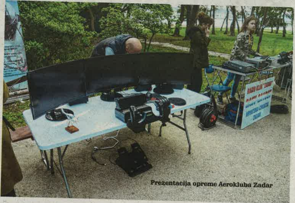
Prezentacija opreme Aerokluba Zadar