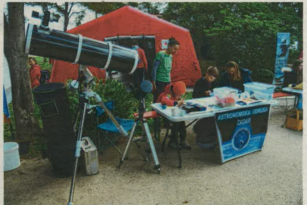
Članovi Astronomske udruge Zadar na teren su donijeli jedan od svojih 50 - ak teleskopa