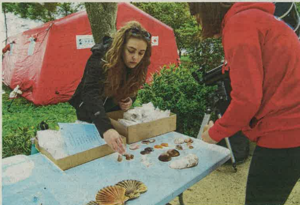
Priprema malakološke zbirke Ronilačkog kluba sv. Roko iz Bibinja

Programu, koji je organizirala Zajednica tehničke kulture Zadarske županije i koja je pripremila uskršnu modelarsku i brodomakarsku radionicu, pridružili su se Ronilački klub sv. Roko iz Bibinja, koji je, osim tradicionalnih zarona i čišćenja