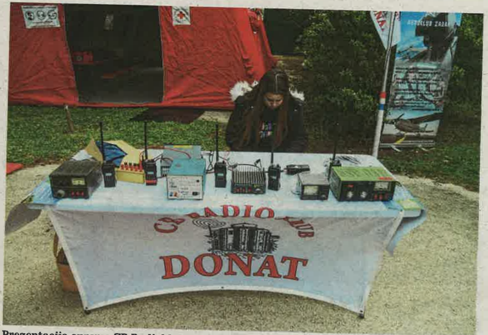
Prezentacija opreme CB Radiokluba »Donat«

2D simulator, koji posjetitelji mogu vidjeti služi simuliranju uvjeta u civilnim zrakoplovima, a imamo i vojne varijante, no cilj nam nije simuliranje vojnih uvjeta, već upoznavanje sa što širim rasponom zrakoplovnih mogućnosti i situacija prilikom leta. U klubu imamo još nekoliko računala u virtualnoj stvarnosti, kao i simulator G sila, koja su umrežena u klasični multiplayer, zaključio je Stručić.