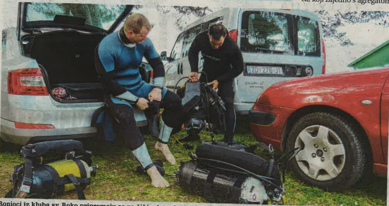
Ronionci iz kluba sv. Roko pripremaju se za čišćenje podmorja na Puntu Bajlo